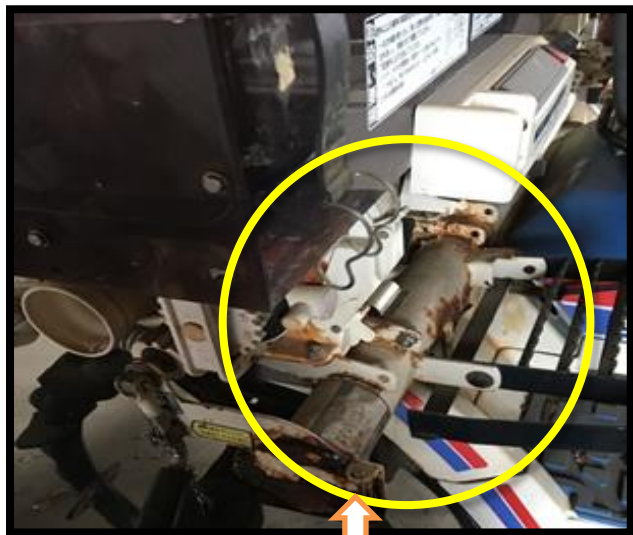
《施肥機周辺の錆び》