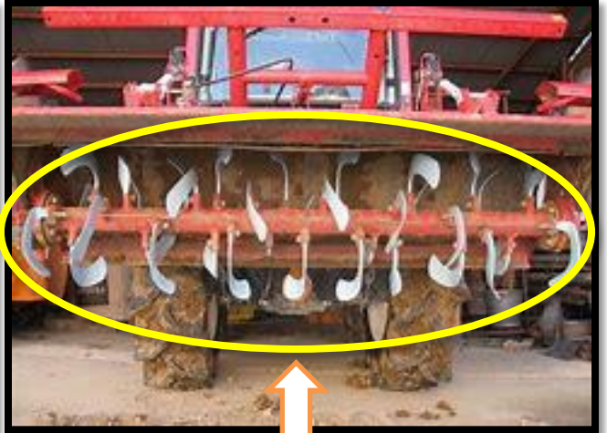
《油漏の有無》 機械の稼働部、配管、パイプ等から油が漏れていないかの確認