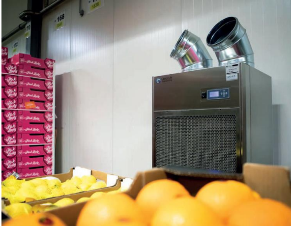
【スーパーマーケットチェーンの中央倉庫】 カビ胞子を捕集し、商品や建物の カビ繁殖防止