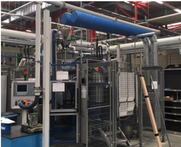
【部品工場】 成形マシン内の粉塵堆積を低減し 設備停止の予防