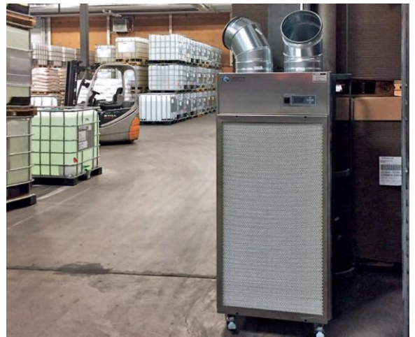
【物流倉庫】 保管商品の埃ふき取り 時間の削減