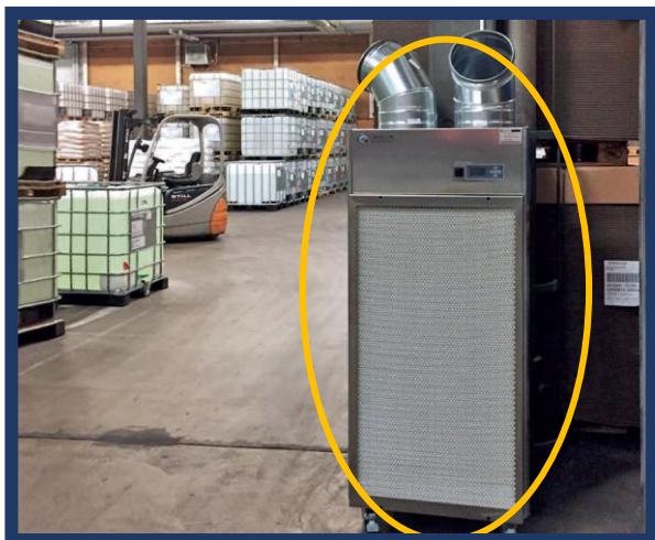
【物流倉庫】 保管している商品の埃ふき取り 作業時間削減