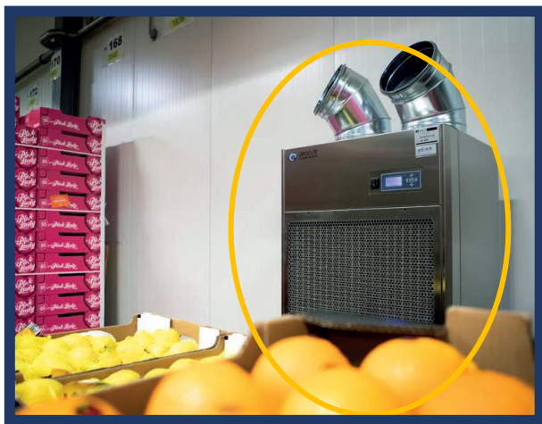
【スーパーマーケットの中央倉庫】 カビ胞子を捕集し、商品や建物の カビ繁殖防止