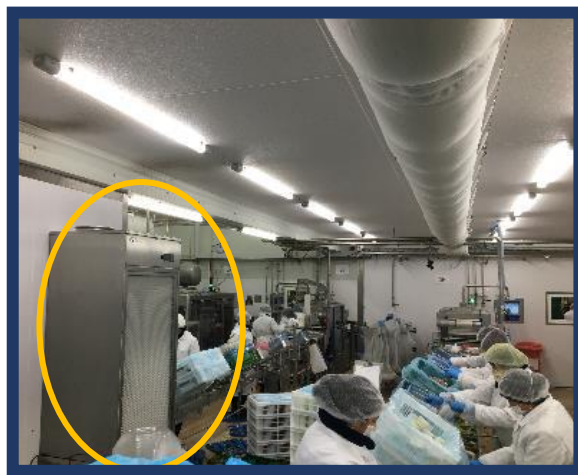
【サラダ工場】 浮遊菌(落下菌)の 低減 により消費期限が延長