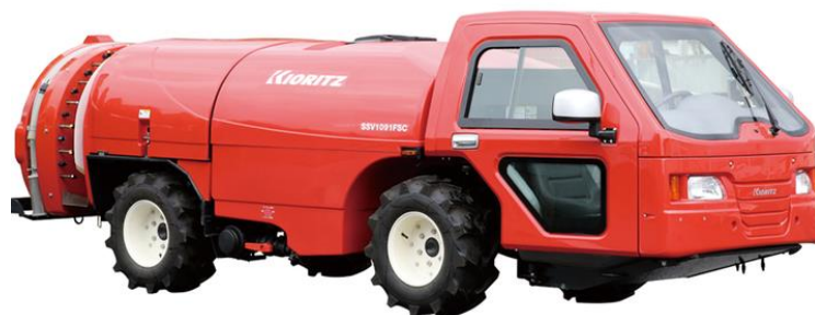
1000L シリーズ (型式: SSV1091FSC/A)