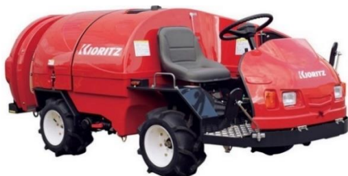
500L シリーズ (型式: SSV553F/EPA)